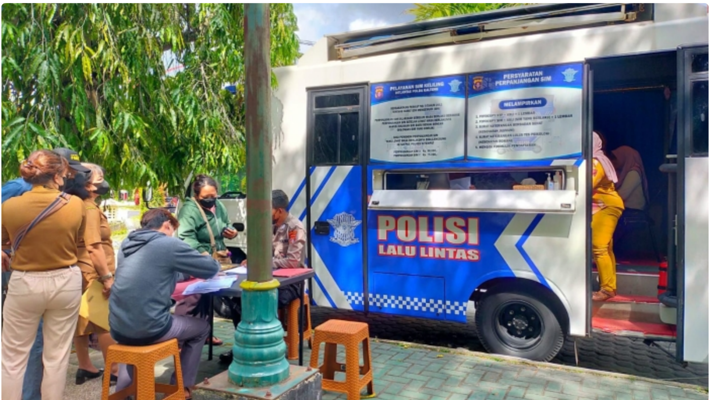
Bus Keliling Dirlantas Polda Kalteng

PALANGKA RAYA - Direktorat Lalu Lintas (Ditlantas) Polda Kalteng berikan pelayanan Surat Ijin Mengemudi (SIM) keliling bagi masyarakat Kota Palangka Raya. Selasa (6/12/2022) Pagi.